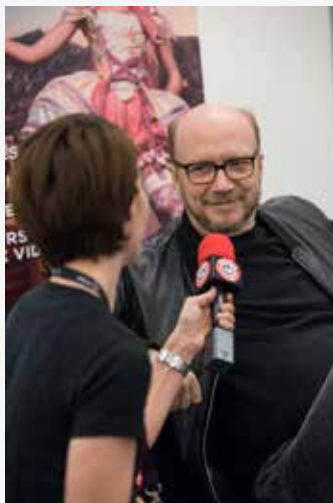
Paul Haggis (Casino Royale)