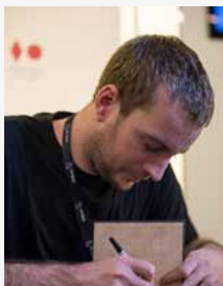
Raoul Barbet (Life is Strange)