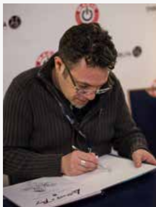
Didier Tarquin (Lanfeust de Troy)