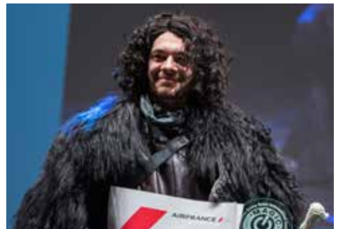
Halcyon, grand gagnant du concours Cosplay Grand Public