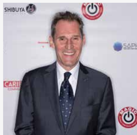
Ben Cross (Star Trek)