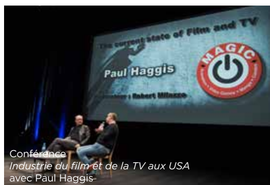
Conférence Industrie du film et de la TV aux USA avec Paul Haggis