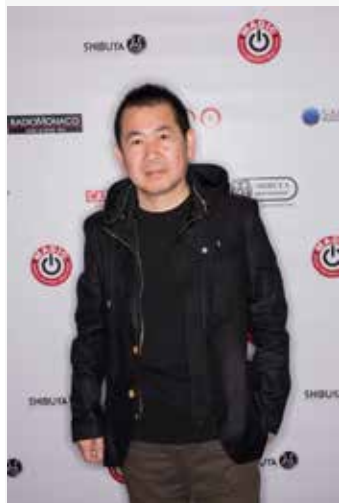
Yu Suzuki (Shenmue)