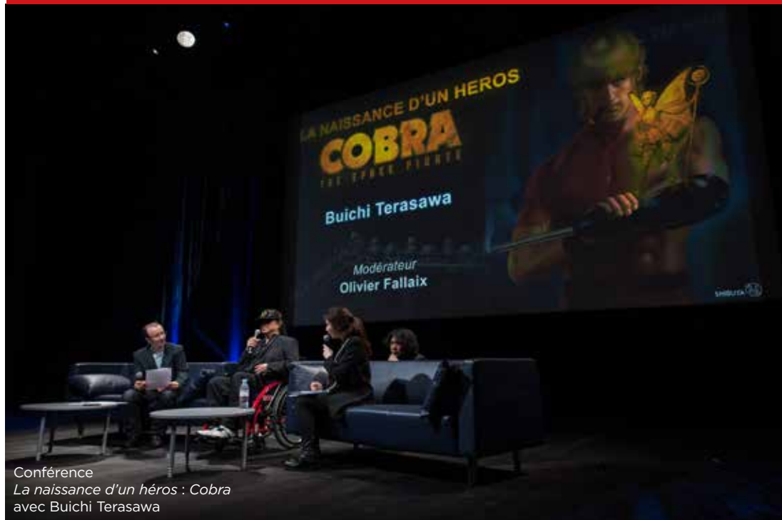
Conférence La naissance d'un héros : Cobra avec Buichi Terasawa