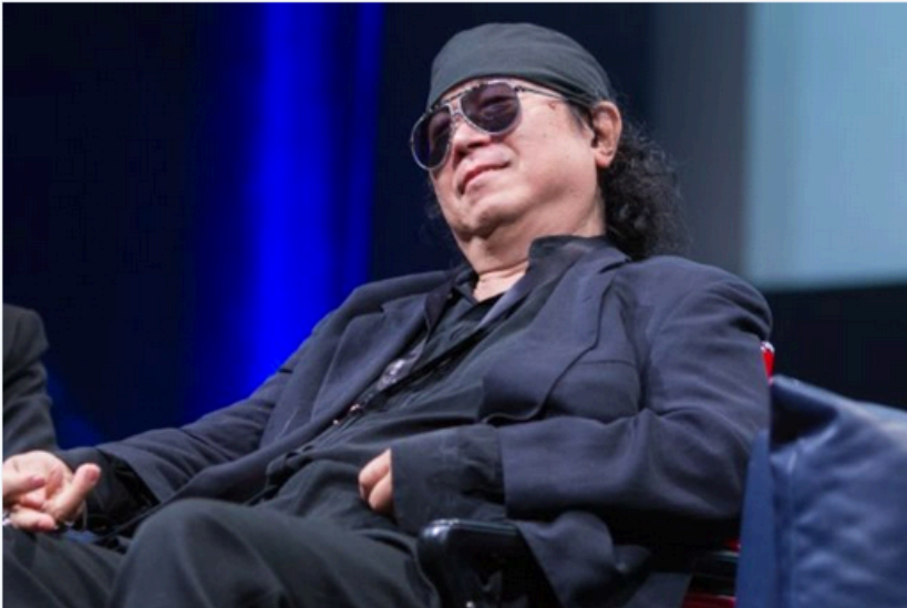
Buichi Terasawa au festival Magic.

Mark Millar et John Romita Jr. (les créateurs de Kick-Ass ), Yu Suzuki (le concepteur des jeux Virtua Fighter et Shenmue ) ou encore David Lloyd (le dessinateur de V pour Vendetta ) ont partagé l'affiche, samedi 27 février, de la deuxième édition du Salon Magic (pour Monaco anime game international conference) aux côtés du mangaka vedette Buichi Terasawa. Tout amateur de pop culture japonaise qui se respecte connaît forcément l'œuvre phare de ce dernier : Cobra .