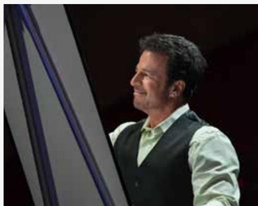
John Romita JR (Kick-Ass, Spiderman)