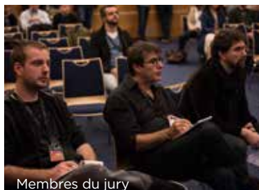
Membres du jury