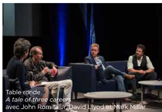
Table ronde A tale of three careers avec John Romita Jr, David Lloyd et Mark Millar