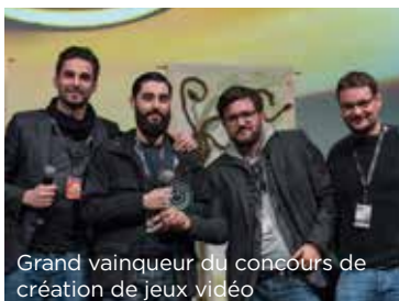
Grand vainqueur du concours de création de jeux vidéo