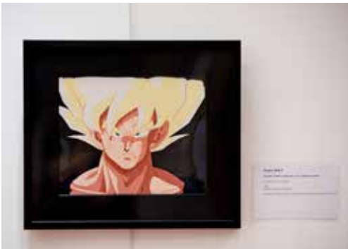
Celluloïd original de Dragon Ball Z

Cette exposition retrace l'histoire du dessin animé japonais, trésors de la télévision, de 1960 à nos jours.