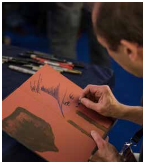
Séances de dédicaces en présence de Miss MAGIC