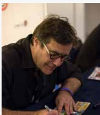
Christophe Héral (Rayman Origins)