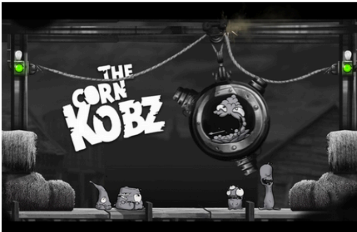
Pour son projet Epic Loon, 3DDUO a remporté un prix de 100.000 euros. - 3DDUO