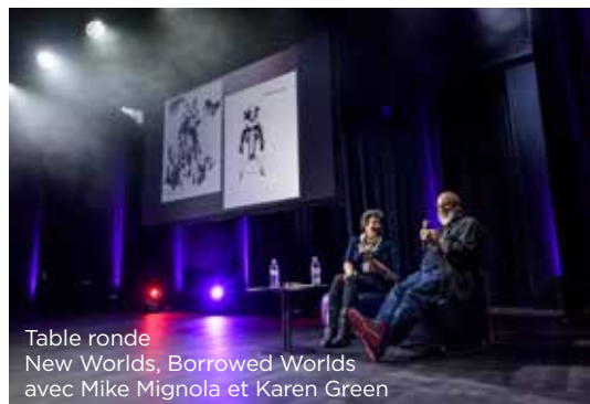
Table ronde New Worlds, Borrowed Worlds avec Mike Mignola et Karen Green