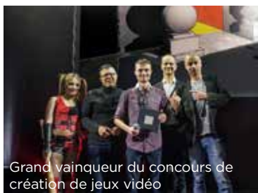
Grand vainqueur du concours de création de jeux vidéo