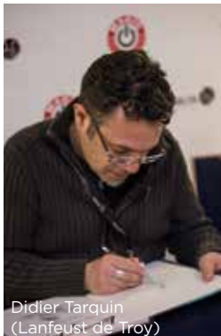
Didier Tarquin (Lanfeust de Troy)