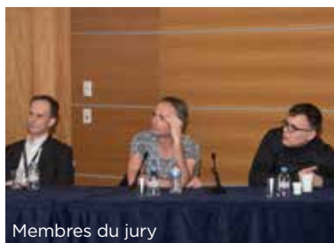
Membres du jury