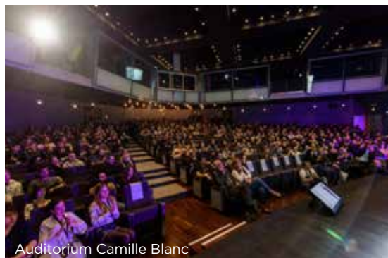
Auditorium Camille Blanc