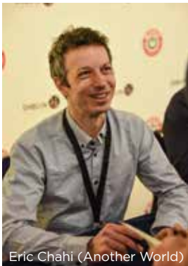
Eric Chahi (Another World)