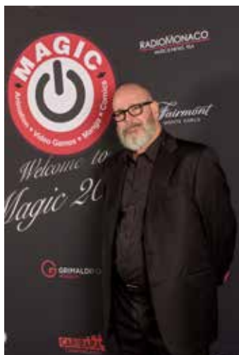
Mike Mignola (Hellboy)