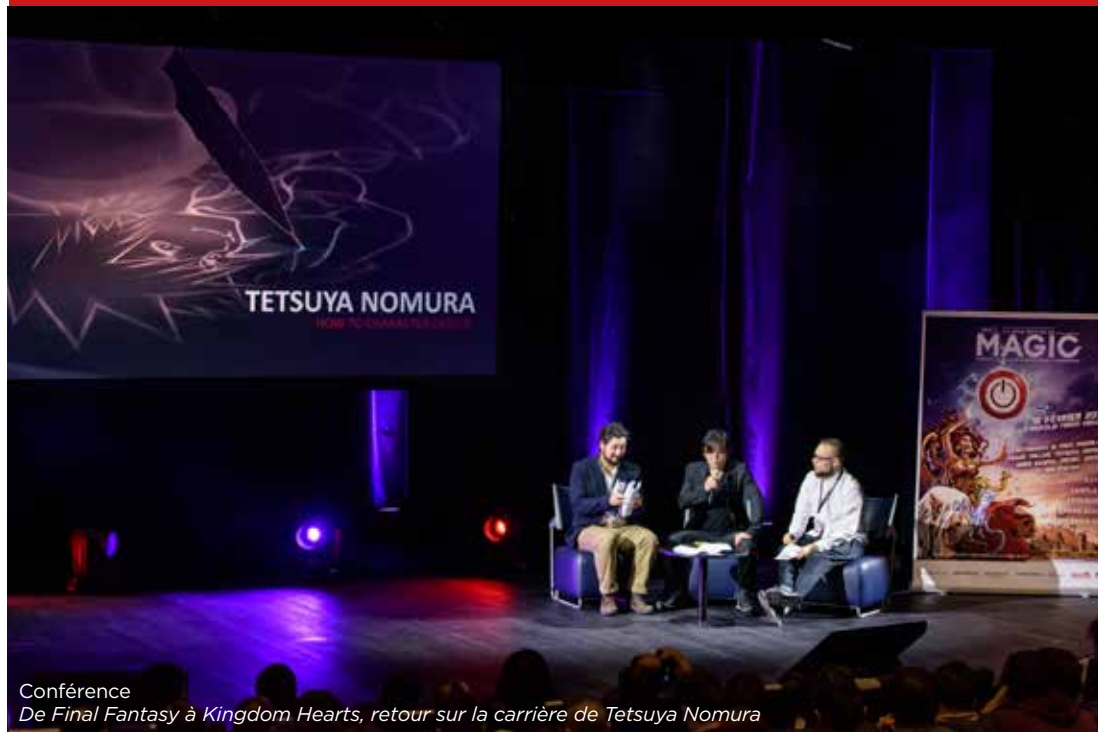
Conférence De Final Fantasy à Kingdom Hearts, retour sur la carrière de Tetsuya Nomura