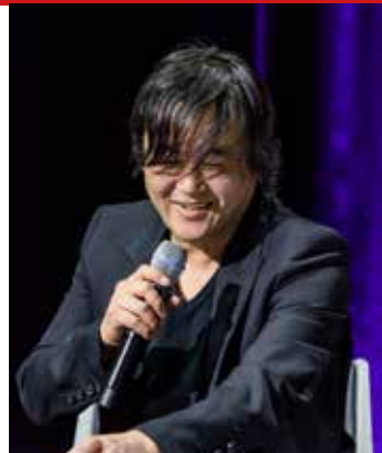
Tetsuya Nomura (Final Fantasy)