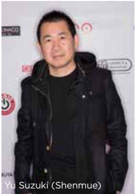
Yu Suzuki (Shenmue)