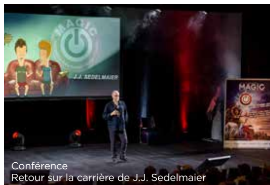
Conférence Retour sur la carrière de J.J. Sedelmaier