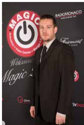
Raoul Barbet (Life is Strange)