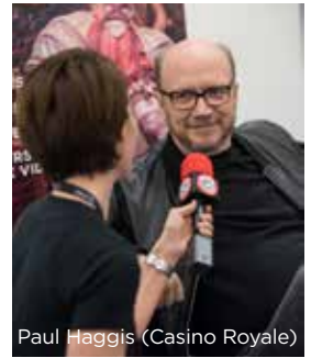
Paul Haggis (Casino Royale)