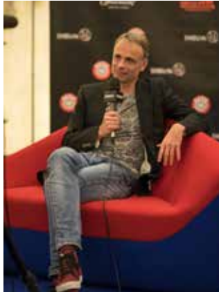
Michel Ancel (Rayman)