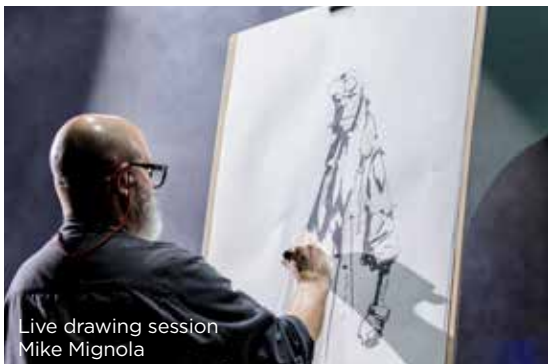
Live drawing session Mike Mignola