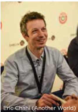
Eric Chahi (Another World)