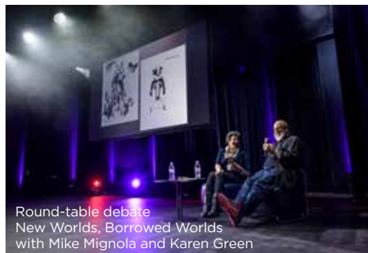
Round-table debate New Worlds, Borrowed Worlds with Mike Mignola and Karen Green