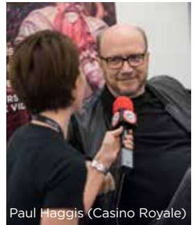
Paul Haggis (Casino Royale)