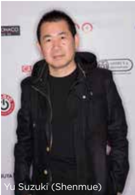
Yu Suzuki (Shenmue)