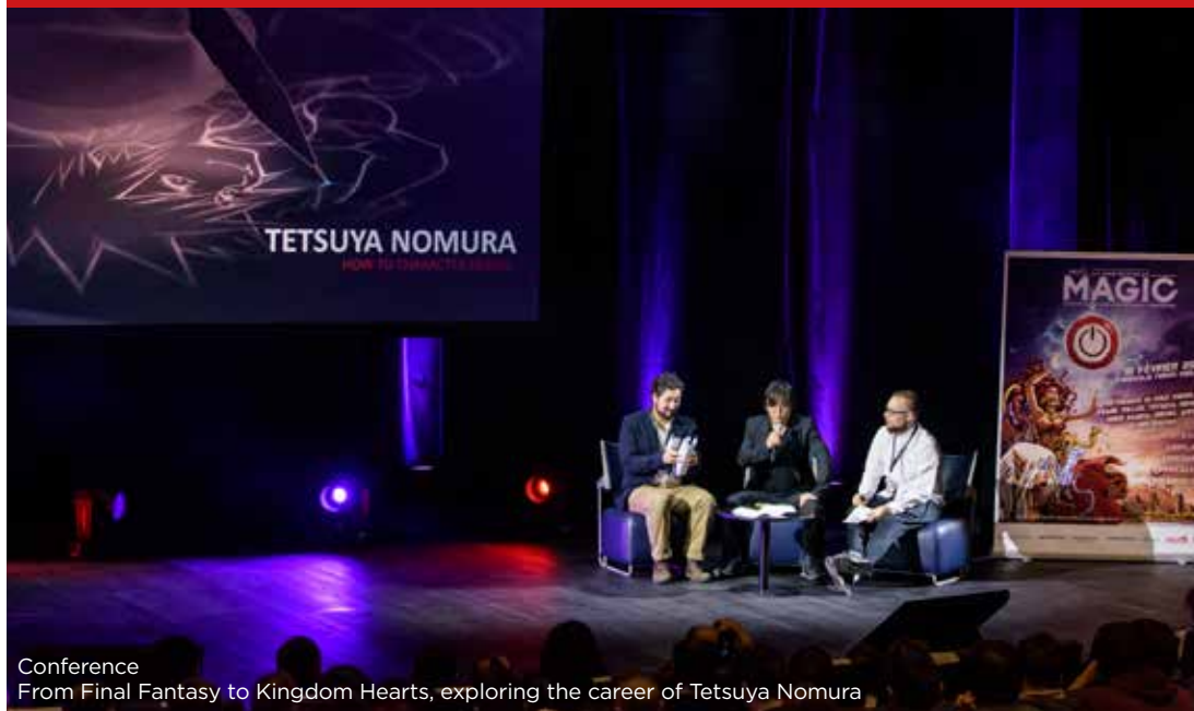
Conference From Final Fantasy to Kingdom Hearts, exploring the career of Tetsuya Nomura