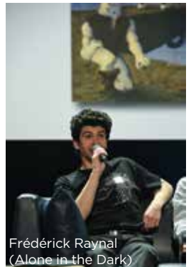
Frédéric Raynal (Alone in the Dark)