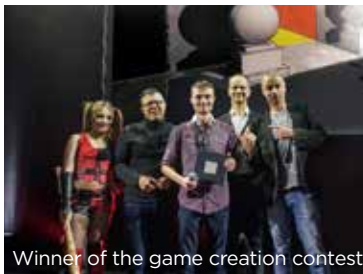
Winner of the game creation contest