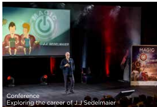
Conference Exploring the career of J.J. Sedelmaier