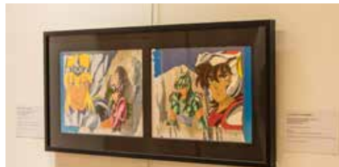
The Art of Anime