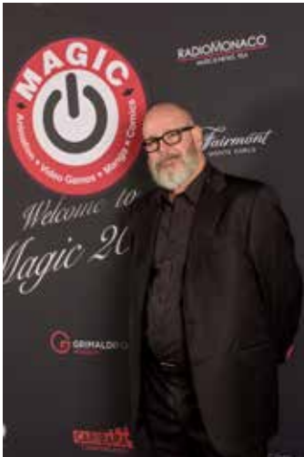
Mike Mignola (Hellboy)