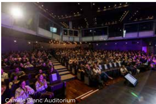
Camille Blanc Auditorium