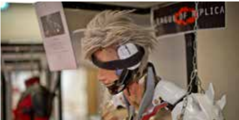
League of Replica