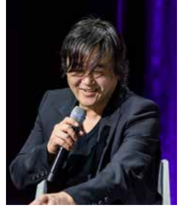
Tetsuya Nomura (Final Fantasy)