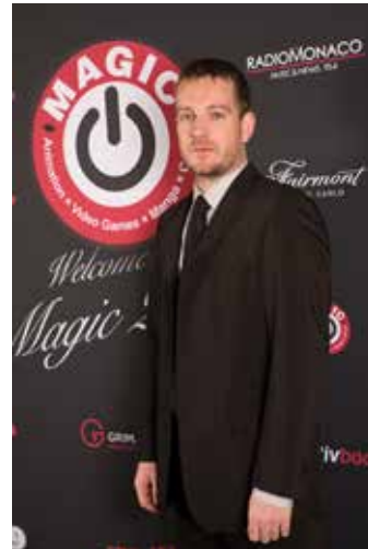
Raoul Barbet (Life is Strange)