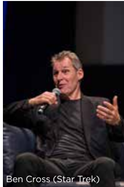
Ben Cross (Star Trek)